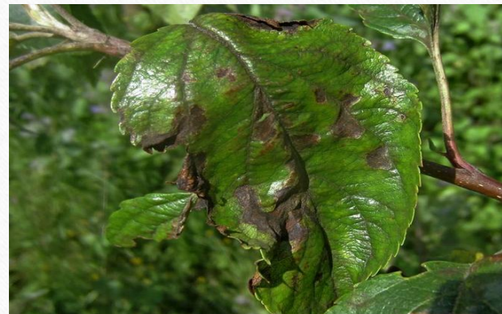
Чађава краставост листа јабуке

У погледу биљних болести, на усјевима пшенице уочено је присуство симптома жуто-мрке пјегавости, сиве пјегавости листа и класа пшенице, као и пепелнице стрних жита, које у повољним условима могу довести до смањења приноса и квалитета зрна.